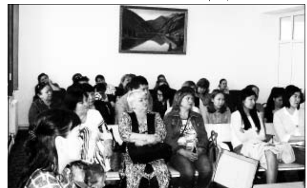
алкоголизма и курение; - Воспитание патриотизма. Все семинары прошли в доверительной дружеской