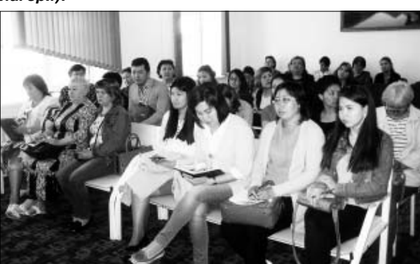
Важной задачей в период проведения летней оздоровительной кампании является профилактика инфекционной заболеваемости и обеспечение санитарно-эпидемиологического