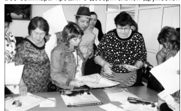
обстановке. По окончании все участники получили ИОМ по пройденным темам. Н.В. Литвинова, пресс-секретарь ГКП на ПХВ Талгарская ЦРБ