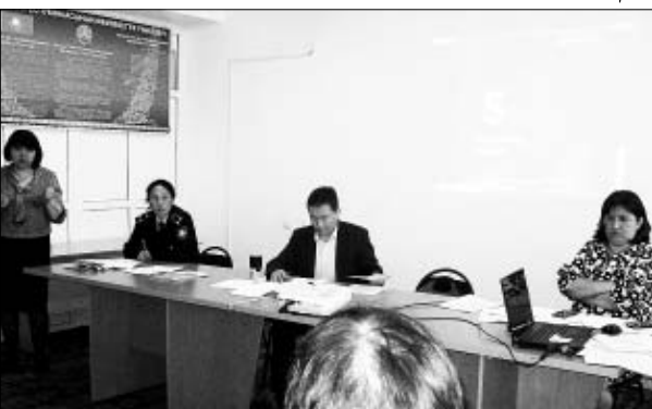
С началом летнего отдыха школьников начнут функционировать ДОЛ (Детские оздоровительные лагеря).