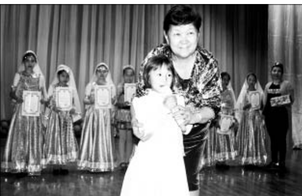
Есть чудо вечное на свете, И это чудо - наши дети! Без них жизнь в черно-белых красках, Без них живем уже не в сказках.

Они как лучики рассвета, Всегда в душе царит их лето. И в День защиты всех детей Желаю нам благих вестей! "Все мы родом из детства" - эти слова, принадлежащие знаменитому французскому летчику, писателю, философу Антуану Экзюпери, давно стали крылатым выражением. В них заключена глубокая, правда, ведь все, что все, что мы берем с собой во взрослую жизнь, было обретоено нами в детские годы. Детство - не только самый уютный уголок души, где живут светлые воспоминания, это еще и прочный фундамент, на котором строится вся дальнейшая жизнь и судьба человека. С высоты прожитых лет и жизненных испытаний детские годы многим из нас кажутся маленьким раем,