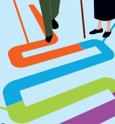
Возраст для прохождения скрининга

Скрининг на раннее выявление предопухолевых заболеваний и рака молочной железы