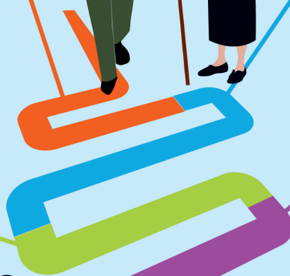
Скринингтен өтуге арналған жас

Сүт бездерінің ісікалды аурулары мен обырын ерте анықтауға скрининг